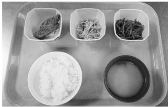
朝食セットメニュー

金沢大学生協では、特に新入生が大学生活において朝食をとる習慣をつけてもらうために、「100円朝食」の取り組みを行って