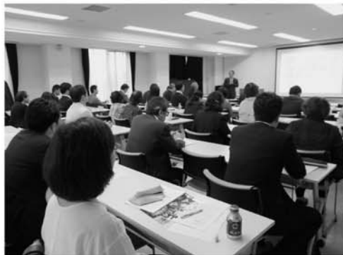
通常総会のようす

前半は、最新の統計資料から、国センに寄せられる相談傾向を解説いただきました。詐欺商法やインターネット、デジタルコンテンツの相談が上位になっており、インターネット関連の相談は年々増加傾向とのことでした。後半は、高齢者保護をテーマに、高齢者の相談は増加傾向にあり、以前からある