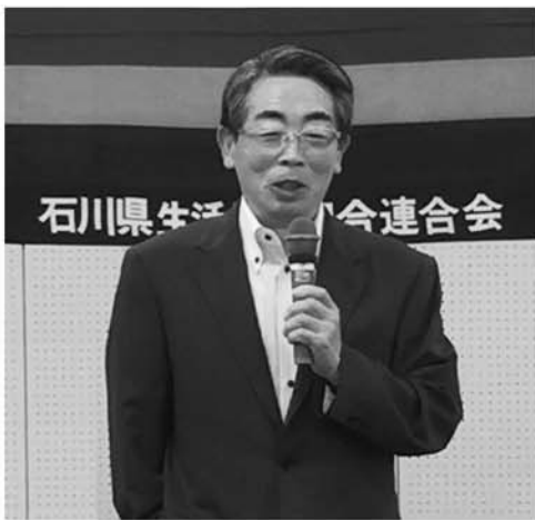
退任挨拶をする横山前会長理事

転機となったのは、生協連創立30周年でした。当時、私が専務理事、会長理事は学校生協さんでした。共