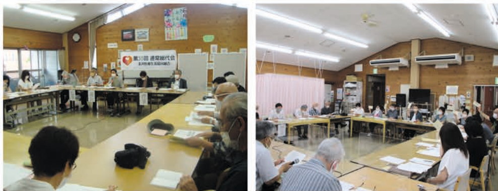
総代会会場の様子