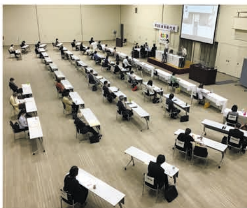
空間をあけた議場

第22回通常総代会は全議案の可決承認をもって終了しました。コロナ禍により、総代と役職員の安全を最優先とし、昨年につき、開催規模を縮小して議事運営を行いました。