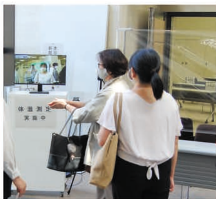
参加者には検温、消毒を依頼

たことで、378名の総代から事前に書面議決書の提出をいただくことができました。総代からは「全ての事業で感染対策の努力に感謝します。おかげで安心して利用できます。」といった取り組みへの感謝の声が今年も多く寄せられました。これからも、それぞれを認め合い、一人ひとりの意見が大切にされる総代会議、総代会運営をすすめていきます。