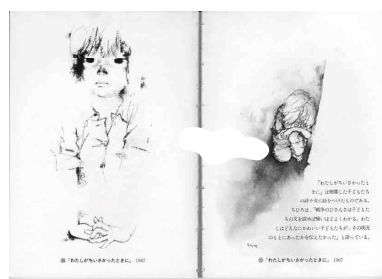
絵本・「わたしがちいさかったときに」1967 / 絵・いわさきちひろ