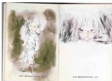
絵本・「戦火のなかの子どもたち」1972 / 絵・いわさきちひろ