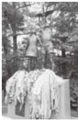
折り鶴で飾られた「平和の子ら像」

3年ぶりに卯辰山での開催となった2012ピース・デイに、実行委員会構成団体より150名が参加しました。