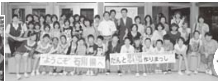
歓迎セレモニーにて