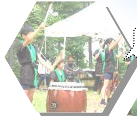
オープニングは、子ども太鼓ハンプー

8月6日、9日、15日の前に参加すれば、家族で話し合える良いきっかけになります。家族連れでの参加をお待ちしております。