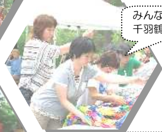
みんなで千羽鶴を献納。