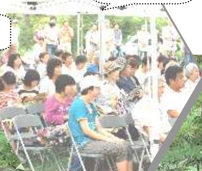
当日はテントもあるヨ！

■と き：7月27日(日) 10:00~12:00 ■ところ：金沢市卯辰山玉兎ヶ丘 原爆碑「平和の子ら」像の前